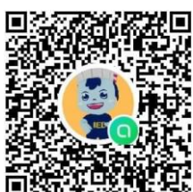
กลุ่มไลน์ IED DEK ๖๗