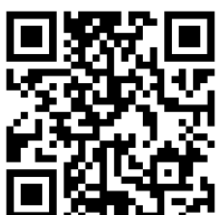
แบบฟอร์มแจ้งเหตุผล ที่ไม่สามารถเข้ารับการสัมภาษณ์ได้