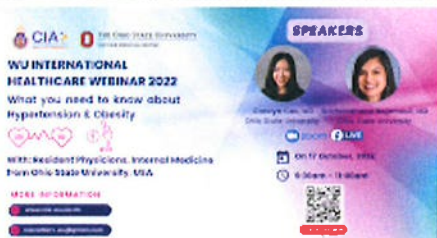
WU Health webinar 2022 Banner (1).png 587K