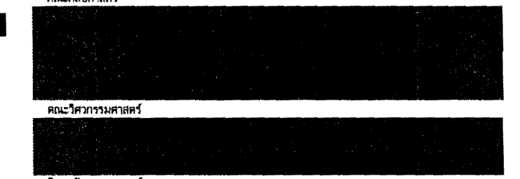
คณะวิศวกรรมศาสตร์