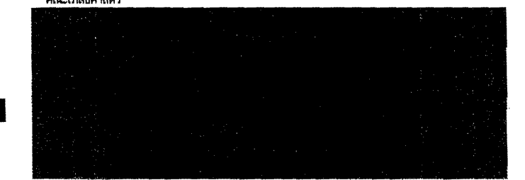
คณะศิลปศาสตร์