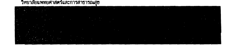
วิทยาลัยนวัตกรรมการศึกษาและการสาธารณสุข