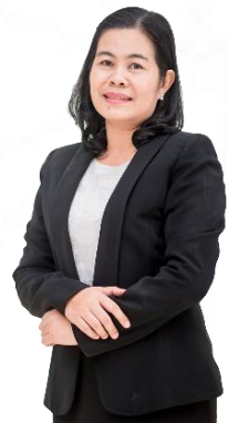
นางทรงนคร การนา CoP 5 การบริหารจัดการ